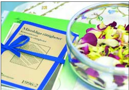
Budskap. I stället för det kristna budskapet handlar namngivningsceremonin om barnet, föräldraskapet och människan och vilken miljö som barnet ska växa upp i.